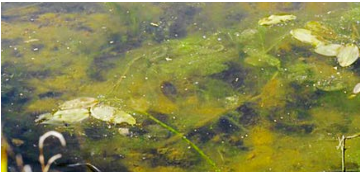
Ljudkonstinstallationen kräver närvaro och tid av besökaren.